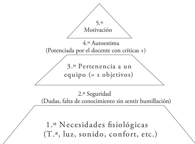
FIGURA 2. Factores que influyen en la motivación del alumno